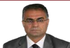
ئەخلاق له گوتاری بزوتنه وه ی نەتووه ی دا