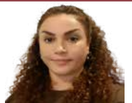
دادخوازی و نه بوونی عدالەت له نیو خۆی ولات دا