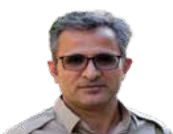
ئەو دەریای خوینە قەت هەتە چۆرا

چاودیرانی سیاسی و چالا کانی مه دهنی ده لێن له ئیستادا که قووتی ژیان و گوزد ه رانی خه لک گرینگترین باب ته ی کۆمه لگه یه، به لام هه م ده ولت و هه م مه جلس گوینان له ناره زایه تییه کانی خه لک نووقاندوو و هه ردوولا هه یج به رنامه یه کیان بۆ چاره سه ری کیشه کانی بژیو و به ریچونی خه لک نییه.