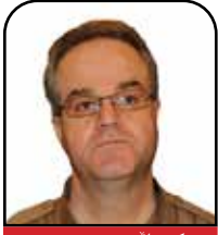
و: کمال حسن پوور

مستهفا ئەلکازمی، سەرۆک وەزیرانی عێراق شانسێ هه‌بوو که له هێرشێ فرۆکەیی بێ فرۆکەوان له بەرەبەیانێ روژی یەکشەممە بۆ سەر ماله‌کەئێ تەنیا به برینیکێ سووک بزگاری بوو، که له وتارەکەئێ سەر تەله‌فیزیۆن دوا هێرشه‌که له بانداژێ مه‌چه‌کی چه‌پێ را دیار بوو. به‌لام سەرەرای داواي له‌سەرەخۆبوون و درێژه به کاره‌کان بدهن وه‌ک هه‌چ نه‌قه‌وما‌بێ، کازمی ناتوانی ئه‌و زبهره قورسه‌ بشاریته‌وه که به‌ر جه‌سته‌ی سیاسیی عێراق که‌وتوو. ئه‌و نابێ هه‌ولی ئه‌و کاره‌ش بدا.