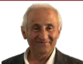
دادگای گەل چەند وانە یە ک بۆ نەتووی کورد