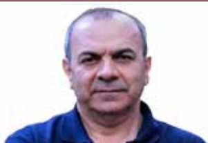
کێ له خویندنی چەند زمانە دەرتر سێ؟