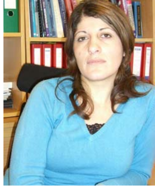
کو یستان گادانی

بە داخ وە دە بی بڵیم کە ژنان لە کۆ مە لگای کوردە واری دا هە ستنی با وەر بە خۆ بوونیان ژۆر کە مە ، ژۆر ژو تە سلیم دە بن ، کە م تر بە شدار دە بن لە چالاکیە کۆ مە لایە تی و سیاسی یە کان دا و هتد . دیا رە هەر یە ک لە وانه ش هۆ ی تاییە تی خۆ یان هە یە بە لām بە داخ وە ژۆر یە ک لە وانه بوون بە داب و نە ریت و جیا کردنە وە یان ژۆر زە حە م تە و کار کردنیکی ژۆری دە و ی بە تاییە ت لە لایە ن خۆ یی ژنانە وە . ژیبا سەرورە ئی: ژنان دە بی ویست و داخوازی یە کانی خۆ یان بە رنە سەر ، چیدی کە بە وە رازی ئە بن کە لە نێ و حیزبدا کە م تە و جو هییان پێ بکری . ژنان دە بی مە رج و شە رتیان هە بی و نە تە نیا لە نێ و خۆ ی حیزب بە لکۆ پو و بە دە رە و ی حیزبیش دە نگی نا رە زایە تی خۆ یان دە ربەر . پێ م وایە ئە گەر ئە و دە نگی روو بە دە رە وە بی ت ، حیزب مە جبوور دە بی ت بکۆشی بۆ گۆرانی کاری و ژنان پشتی وانی لە یە کتر بکەن و پایە لێ یە کێ بە هیزی جوولانە وە ی ژنان پێ ک بی ت .