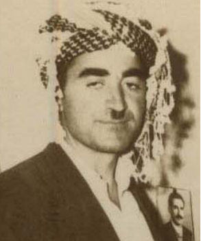
ويتی ٤٢ سال له مهربری کاک عومر بابامیری

وه سته نه حمده ی کانی زهردی، باوکی شهيد ملا خدی کانی زهردی و له دلسو زانی ديړینی حيزبی ديموکراتی کوردستان و تيکوشه رانی حيزب له ناوچه ی سهردهشت بوو. کاک حه مه ره سوول روسته م پور (خه لکی ناوای بيورانی خوار) که سيکی خو ش ناوی ناوچه که بوو که هه رده م يارو يارمه تيدهری حيزب و بزوتنه وه ی کوردستان بوو.