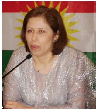
گولاله شه ره فکه ندی

به کورتی ده توانم بلیم: — پی داچوونه وه ی پی وه ی پروگرام، گو پینی دیسکۆرس له حالته تی پیاوونه، دووباره نووسینه وه ی نه و به شان له زمانی ژنان یا. — دابین کردنی دهره سه دی کارو به پرسایه تی بۆ به شداری ژنان. — پیکه یانی فرسه ت بۆ ئالوگوری بیروپای ژنانی نیو حیزب له گه ل ریکخواه کانی تر.