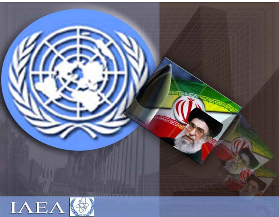
ژماره‌یه‌ی "کوردستان" دا دوو وتار هه‌ن که سه‌رنجتان بۆ خۆپێندنه‌وه‌یان راده‌کێشین.

سه‌ره‌نجام رۆژی شه‌مه ٢٠٠٦/١٢/٢٣ رێک‌ه‌وتی ١٣٨٥/١٠/٢ ژماره ١٧٢٧ی ئه‌نجومه‌نی ئاسایشی رێکخراوی نه‌ته‌وه یه‌کگرتوه‌وه‌کان له پێوه‌ندی له‌گه‌ڵ به‌هرنامه ئه‌تۆمی‌یه‌کانی کۆماری ئیسلامی دا ده‌رچوو. ئه‌مه دووه‌مین بریارنامه‌ی ئه‌و ئه‌نجومه‌نه له‌و خالی جێگای خۆشحالی ئه‌وه‌یه که بریارنامه‌ی ١٧٢٧ سێره‌ی ته‌نیا له به‌هرنامه ئه‌تۆمی‌یه‌کانی کۆماری ئیسلامی گرتوه و گه‌مارۆیه‌کی نه‌خستۆته سه‌ر ئێران که زیان له ژيان و قازانچه مه‌شرووعه‌کانی گه‌لانی ئێران ب‌دا. جیاکردنه‌وه‌ی کاربه‌ده‌سته دژی گه‌لی‌یه‌کان و به‌هرنامه پرمه‌تسی‌یه‌کانیان له گه‌لانی ئێران ده‌توانی له‌م باره‌یه‌وه هه‌ر له‌م