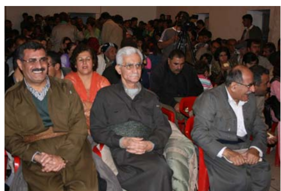
ئه‌م زات‌ه‌مه‌زنه له ره‌وتی بزوتنه‌وه‌ی نه‌ته‌وه‌یی کورددا به‌رز راگیرا و په‌یمانی وه‌فاداری و به‌ئینی درێژه‌دانی رێبازی له‌گه‌ڵ نوێ کرایه‌وه.

◆ جێژنی دوو جێژنتان پیرۆز ئه‌مه‌سال جێژنی قوربانی موسلمانان و جێژنی سه‌ری سالی زاینی ده‌سته‌ملانی یه‌کتر بوون. به‌ بۆنه‌ی هه‌ر دوو جێژنی قوربان و ده‌ست پیکردنی سالی ٢٠٠٧ی زاینی، له قوولایی دلمانه‌وه پیرۆزیایی له موسلمانان و مه‌سیحی‌یه‌کانی کوردستان، ئێران و هه‌موو جیهان ده‌که‌ین. به‌ ئاواتی تێپه‌رکردنی جێژنتیک پێ له خێرو خۆشی، به‌و هیوایه که سالی ٢٠٠٧، سالیکی خۆش بۆ نه‌ته‌وه‌که‌مان بۆ هه‌موو ئۆگرانی ناشتی و ئازادی و دادپه‌روه‌ری بێ. جێژنی قوربان و جێژنی سه‌ری ساتان پیرۆز "کوردستان"