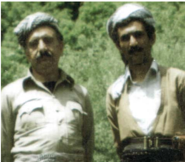
سه‌رمه‌یه‌ی هه‌ره‌ گه‌وره‌ی حیزبی ئیمه‌، پشتیوانی گه‌لی کورده. پێشه‌ره‌گی له گه‌ل جیا نیه‌و جیاش ناکرێته‌وه. پێشه‌ره‌گی

"کوردستان"، ژماره ١٥٦، سه‌رمه‌وه‌زی ١٣٦٨ - وتاری "سلاو له پێشه‌ره‌گی رۆله‌ فیداکاری گه‌ل"