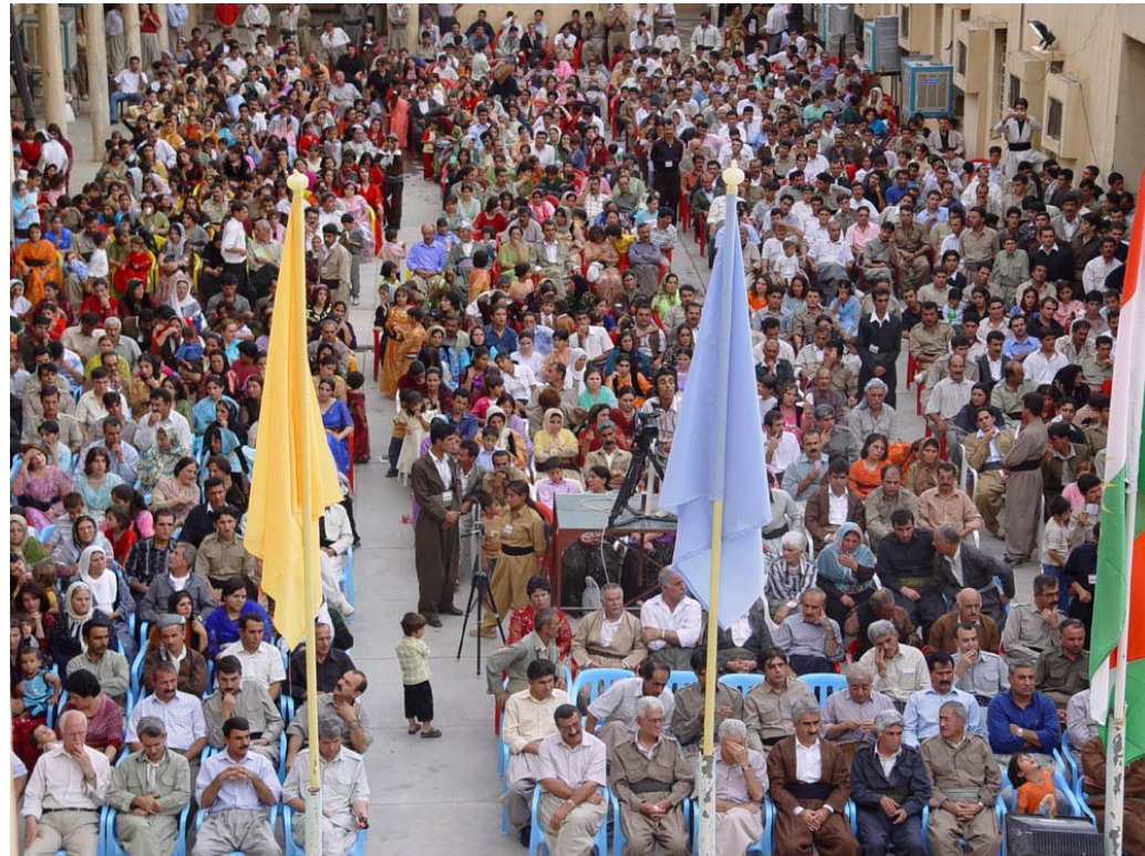
دیمەتیک لە بەشدارانی رۆژی ۲۵ گەلاویژی ساڵی ۱۳۵۸ دامەزرانی حیزب - کۆیە

خوشک و برا بەرپێزەکان! هەمووی ئەو پێشکەوتنەکانماندا لە خەباتی رەوای گەلانی ئێران و یەک لەوان گەلی کورد لە حالیکدا یە کە پێشکەوتنەکانماندا ئیسلامی بە هێزی سیاسەتی فراواخوازی و پشتیوانی کردن لە گروپی توندڕەوێکانماندا وە "حزب اللەو حەماس" و ئازادەنەووە لە ناوچە، پێشکەوتنەکانماندا مافی مرۆڤ لە پەکانماندا نەماندا هەلەدان بۆ بە دەستی هێنانی چەکی نەتەووە، هەر پەکانماندا سەرپێوەری و لاتسی ئیسرائیل لەسەر نەخشی جوغرافیا و زۆر کار کردەوی نامەستولانە دیکە لە لایەن کۆمەڵگای نیو نەتەووە پەکانماندا کەوتەوتە ژێر فشار و توشی قەیرانیکی بوو کە هاتنە دەر لەم قەیرانە نەگەر نەتەووە مەحاله دەتوانن بایین زۆر دژوار. بەهێزێوە پێشکەوتنەکانماندا لەسەر ئەم سیاسەتانە وەلام نەماندا بە داوای کۆمەڵگای نیو نەتەووە پەکانماندا پارگرتنی پێشکەوتنەکانماندا ئێران لە لایان شوروی