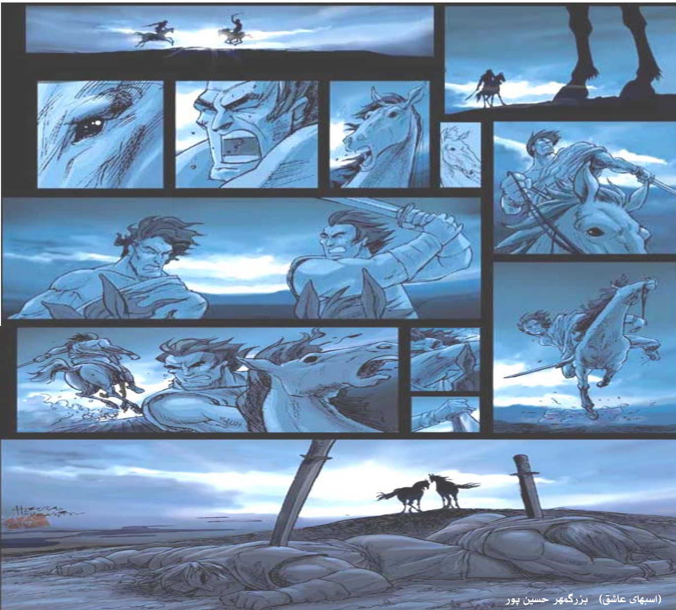
(اسپہای عاشق) بزرگمهر حسين پور