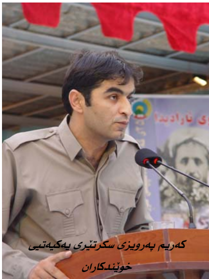
که ریم بهر ویزی سکر تیری یه کیه تیی خویندکاران

خه لکی نازاد یخواری کوردستان! تیکۆشه رانی دیموکرات! خویندکارانی نازاد یخواری!