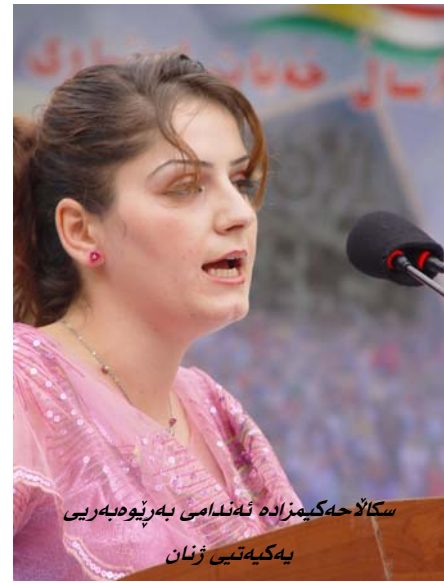
سکلاحه کیمزاده نهندامی بهر پیوه بهریی یه کیه تیی ژنان

هاور تیبانی خوشه ویستا! ناماده بووانی بهر تیز!