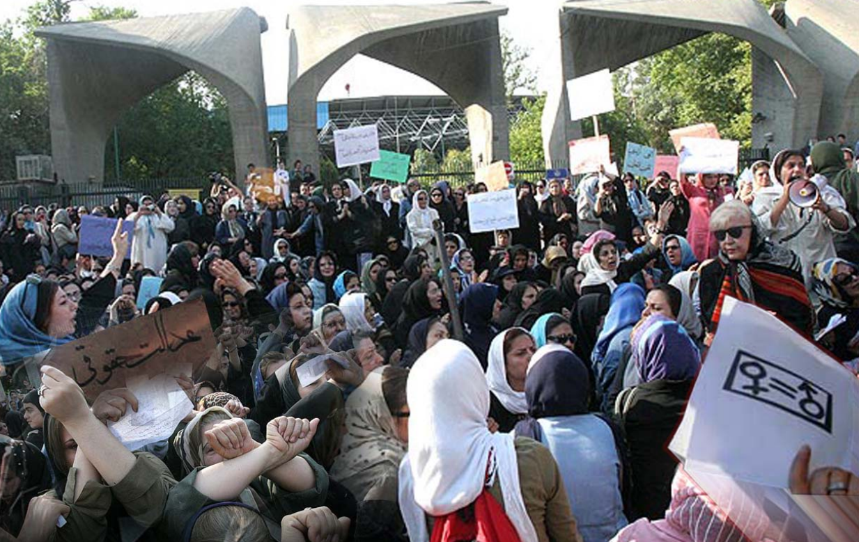
دیهێنیک لە خۆپێشانەکانی سالی رابردووی ژنانی ئێران لە پێش زانکۆی تاران بۆ داواکردنی مافەکانیان

ئێستا، 60 سال لەو کاتە رادەبرێ کە بناغەدانەرانێ ریکخراوی نەتەوێ یەکگرتووێکان، لە یەکەم لاپەری مەنشوری ئەم ریکخراوەدا، یەکسانی مافەکانی ژنو پیاویان گۆنجان. لەو کاتەو، لیکۆلێنەوێ یەك لە دوا یەکان فیری ئێمەیان کردو کە هیچ نامزاتیک بەقەرأ بەهێزکردنی ژنان خزمەت بە پەرەپێدانی ناکا. هیچ سیاسەتیکێ دیکە بەم جۆرە، بەرەمەپێنانی ئابووری بەرەوژوو نایا، یا رادە مەرگۆ لەنیوچوونی مندالان کەم ناکاتەو. هیچ سیاسەتیکێ دیکە بەم رادەیی باشتکردنی خۆراکو برەو پێدانی لەشساعی، بۆ نمونە پێشگرتن لە نەخۆشی ئیدیز دەستەبەر ناکا. هیچ سیاسەتیکێ دیکە بەم رادەیی، لە گەشەپێدانی دەرفەتە فیکاری یەکان بۆ نووێکانی دواتر، کاریگەر نیە. مەن بۆیانە دەلێم هیچ سیاسەتیکێ دیکە بەم چەشنە لە پێشگیری شەرو لە پیکەنناتی ناشتی و تەبایی دوا شەردا، گرتو کارساز نیە. قازانجەکانی بە کردەوێ سەرمايە تەرخانکردن بۆ ژنان بە هەر رادەیکیش زۆر بێ، دیسان گرتنترین حەقیقەت ئەمەیه: ژنان مافی ژیانیکێ تیکەل بەرپۆلەبەریتو کەرەمەت و نازاد لەوێ ئێمە دەمانەوێ، مافی ژیانیکێ بە دور لە ترسو نیکەرانییان، هەیه. لەم رۆژە جیهانی یە ژناندا، وەرن جازیکێ دیکە خۆمان بەرەوێدە بکەینەو کە ئەم حەقیقەتە وەرپاست بگێرین.