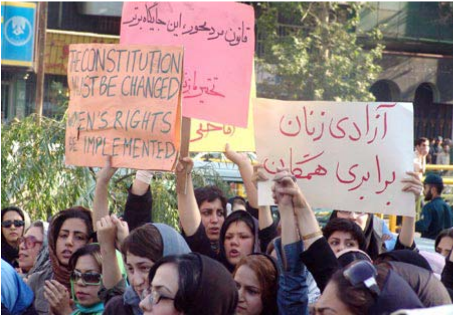
دیمه‌نیک له خو‌پیشاندانی ژنانی ئیران دژی نابه‌ره‌بری

بکه‌نه‌وه و به‌ده‌نگی به‌رز رابگه‌یه‌ننه‌وه که به‌ختیاریی کۆمه‌ل له گره‌ی نازادیی ژنان دایه. ته‌وه‌تا کوفی عه‌ننان، سکر‌تیری گشتی ریک‌خراوی نه‌ته‌وه په‌گرتوه‌کان له مه‌قامی نوپنه‌رو سه‌مولی هاوبه‌شی هه‌موو ده‌وله‌تان و میلیله‌تان، له په‌یامی خو‌ی‌دا، به بۆنه‌ی ۸ مارسی نه‌مه‌سائه‌وه، ده‌لئ: "لیکۆلینه‌وه په‌ک له دوا‌ی په‌که‌کان فیری نیتمه‌یان کردوه که هیچ نامرازیک به‌قهره‌ به‌هیزکردنی ژنان، خزمه‌ت به په‌ره‌پیدان ناکا. هیچ سیاسه‌تیکی دیکه به‌م جوړه، به‌ره‌مه‌یتانی نابوری به‌ره‌وژوور نابا، یا راده‌ی مهرگو له‌نیو‌چوونی مندالان که‌م ناکاته‌وه. هیچ سیاسه‌تیکی دیکه به‌م راده‌یه‌ی باشترکردنی خو‌راک و به‌روپیدانی له‌شعاعی، بو نمونه پشگرتن له نه‌خۆشیی نیندیز، ده‌سته‌به‌ر ناکا. هیچ سیاسه‌تیکی دیکه به‌م راده‌یه، له گه‌شه‌پیدانی ده‌رفه‌ته‌فیرکاری‌یه‌کان بو نه‌وه‌کانی دواتر، کاریگه‌ر نیه". (۱) که‌وابوو، ده‌توانین ۸ مارسی، وه‌ک "روژی گه‌شیبینی له باره‌ی دوا‌رژوه‌وه" ش ناو به‌ین. چونکه به نیشاندانه‌وه‌ی لیبرایی ژنان له سه‌ر دا‌واکردنی مافه‌کانیان و، سه‌لمانده‌وه‌ی گه‌شه‌کردن و به‌ره‌و‌پشچوونی روژه‌روژ زیاتری خه‌بات بو په‌کسانی، سه‌رخمان بو لای دووره‌دیه‌نی ناسۆی داها‌توو راده‌کیشی. به‌لام من ناره‌زوو