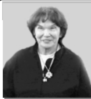
مادام میرزان (سه‌رۆكی بنیاتی فرانس لی‌رتی):

۱۰ ساڵ پاش تیرۆری شه‌ره‌فكه‌ندی ئیمه‌ ده‌توانین ج ئاكامیك له‌و رووداوه‌ دلته‌زینه‌ وه‌رگه‌ڕین؟ هه‌تا كه‌نگی بۆ یاد كرده‌وه‌ له‌ تیرۆری دیمۆكراته‌ ئیرانی‌یه‌كان كۆ بیه‌نه‌وه‌؟ هه‌تا كه‌نگی حكومه‌ته‌كانی ئیمه‌ وه‌شوین سات‌وسه‌ودای قازانج په‌رستانه‌ی خۆیان ده‌كه‌ون و هه‌ق و عه‌دالته‌یان بۆ ده‌كه‌نه‌ قوربانی؟ هه‌تا كه‌نگی ده‌زگا فه‌زایی‌یه‌كانمان ده‌بی ناچار بگه‌ڕین قازانجه‌ ئابووری و سیاسی و ژینۆستراتیژیکه‌ میلی‌یه‌كان وه‌به‌رچا و بگه‌ڕن؟